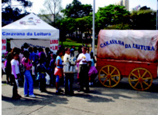
Caravana da Leitura em Diadema

E lá vem a Caravana da Leitura distribuindo livros gratuitamente e, também, vendendo a preços simbólicos em praças públicas. O projeto, neste ano patrocinado pela ZF do Brasil, vem desde 2004, percorrendo várias cidades, fazendo a festa com livros, incentivando o hábito da leitura e formando leitores de todas as classes sociais, etnias e credos. É surpreendente a recepção do