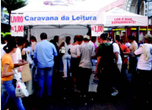
Caravana da Leitura em Osasco

tano do Sul, Osasco e Indaiatuba, em São Paulo; Belo Horizonte, Sabará, Ribeirão das Neves, Pirapora e Montes Claros, em Minas Gerais, Santo Antônio de Pádua, Cardoso Moreira, Italva, Itaperuna e Bom Jesus do Itabapoana, no Estado do Rio de Janeiro.