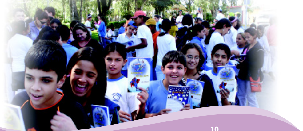
Caravana da Leitura em Conchas.